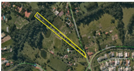
Acesso pela Av. Salvador Caruso Orlando - Medeiros.jpg 677K