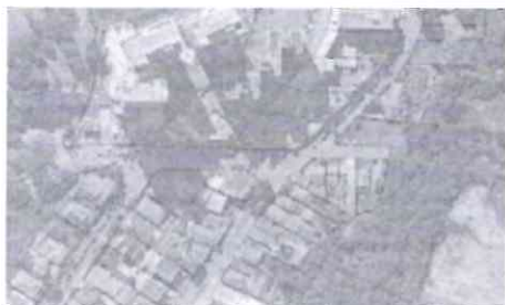
Anexo_0792847_Travessa_da_Com. _Gumercindo_Barranqueiros.jpg 483K