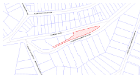
Anexo_0833596_Croqui_Sistema_ de_Lazer__Agua_das_Flores.png 205K