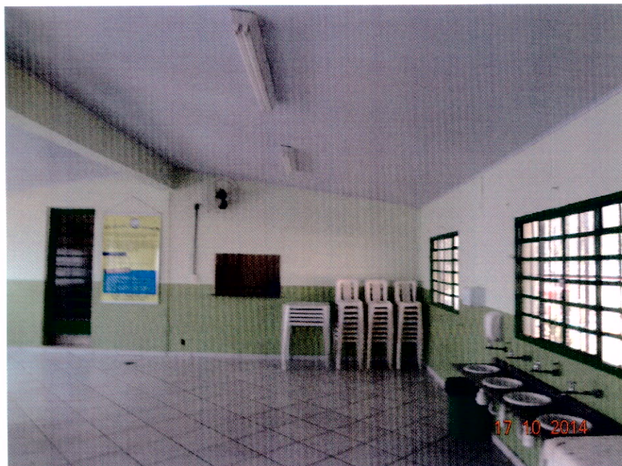
Vista do Interior a Partir da Porta de Entrada