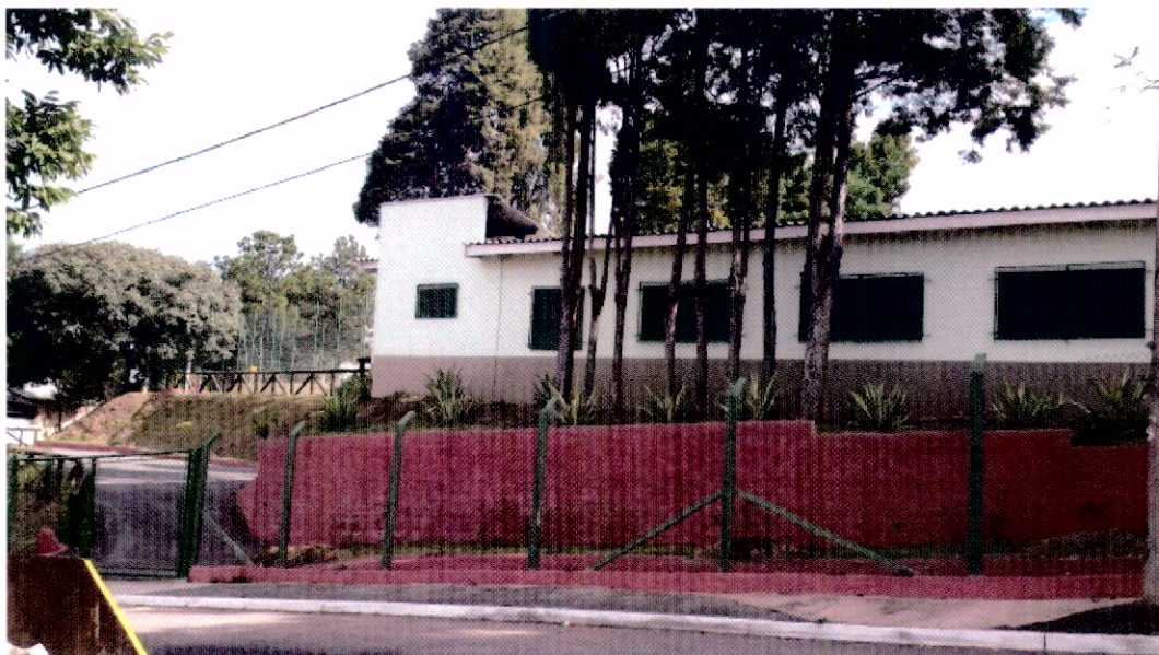
Vista pela Rua Plínio de Almeida Ramos