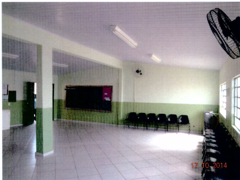
Vista do Interior Para a Porta de Entrada