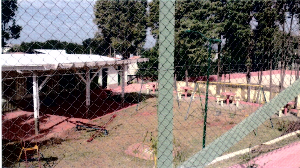
Vista pela Av. José Rossi