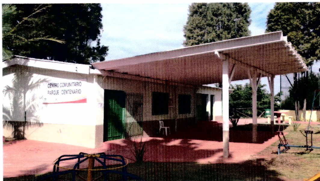
Vista pela Rua Rosa Montanelle Accieri