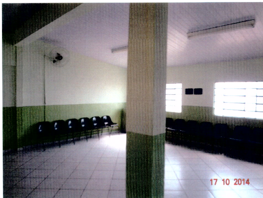
Vista Interna do Salão