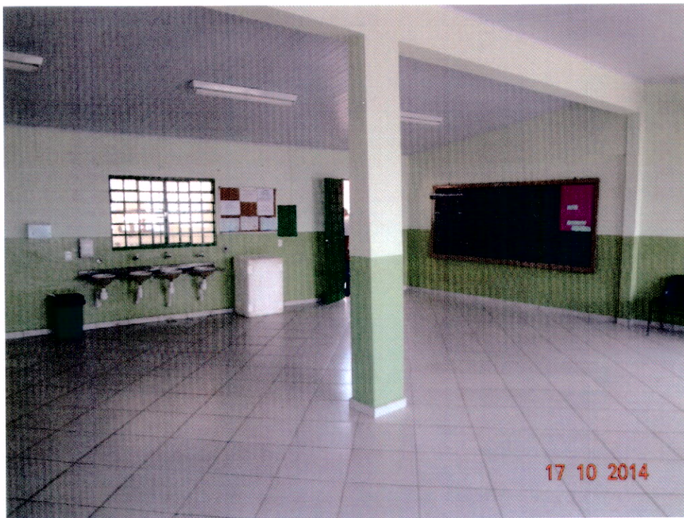
Vista do Interior do Salão