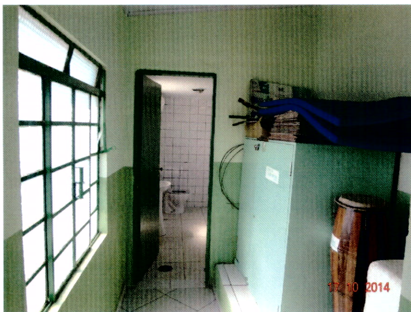
Corredor que de Acesso ao Banheiro