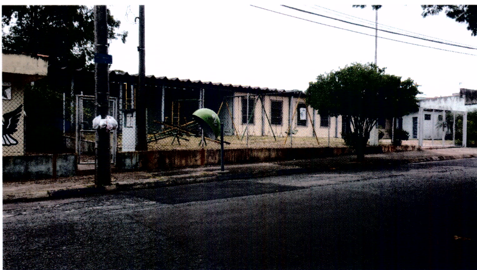
Foto do Centro Comunitário Torres de São José

Perguntado a Diretora Social se havia alguma parceria com relação a esse espaço ela nos confirmou que não . Assim sendo, segue para envio ao Órgão Competente.