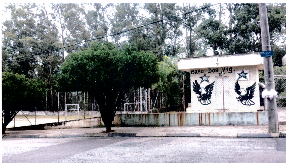
Foto do Centro Comunitário Torres de São José