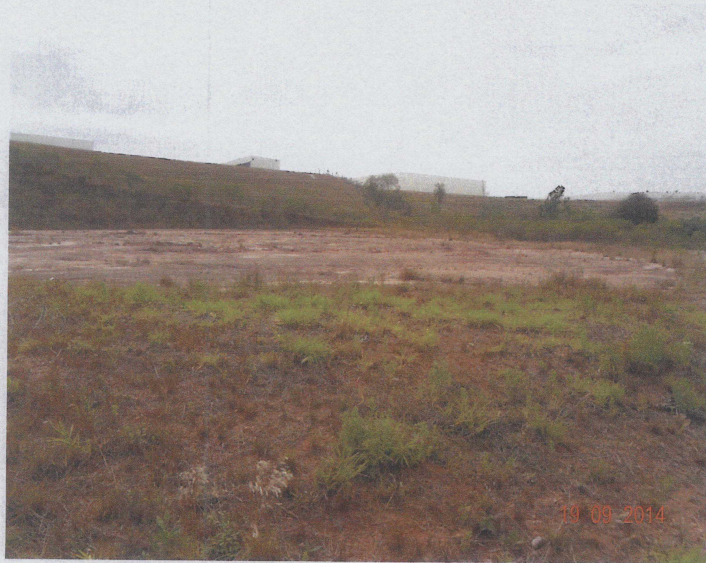
FOTO 03- Vista interna do Bem avaliando.