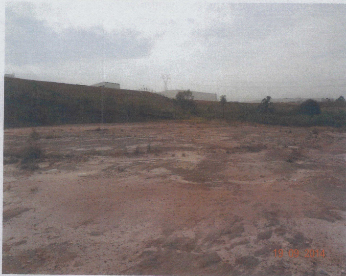
FOTO 04- Outra vista interna do Bem avaliando.