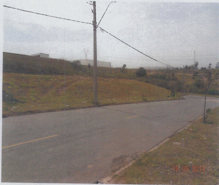
FOTO 01- Vista do Bem avaliando, a partir da Rua 02.