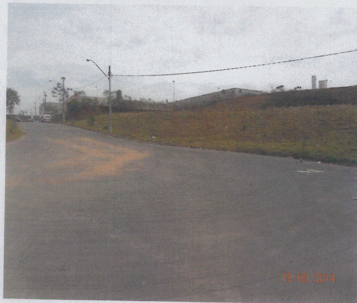
FOTO 02- Outra vista do Bem avaliando, a partir da Rua 02.