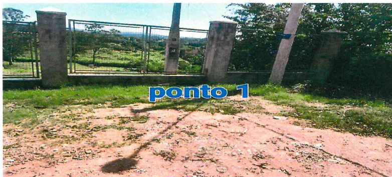
Imagens do dia da visita e o percurso de ônibus (10/11/2023)

(Ofício GP.L nº 381/2023 – Requerimento 301 – fls. 6)