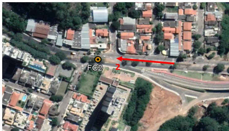
Resultados por faixa horária