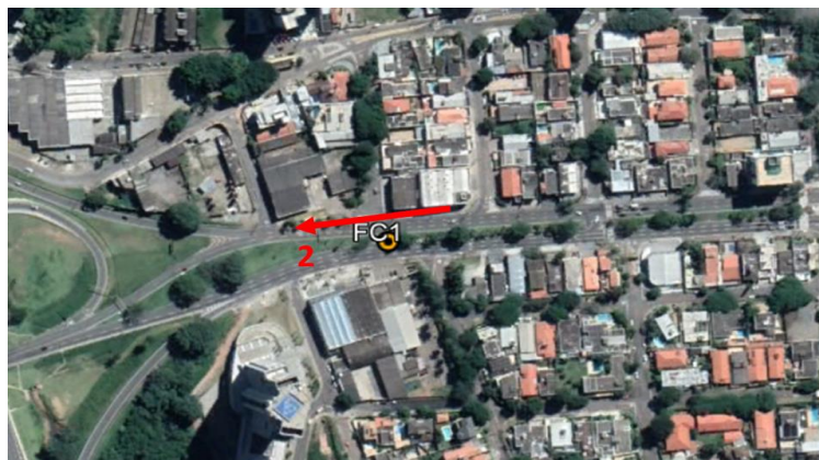
Resultados por faixa horária