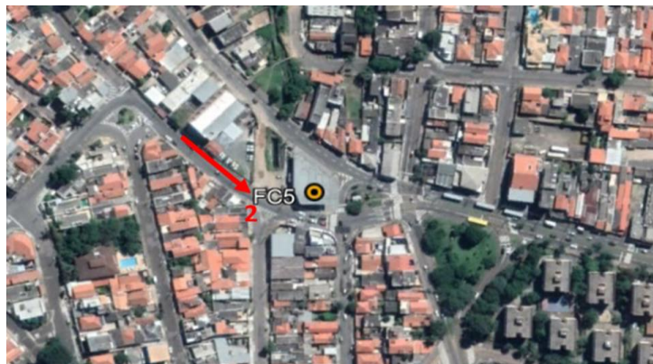
Resultados por faixa horária