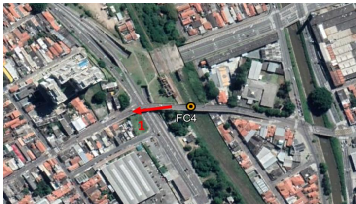
Resultados por faixa horária