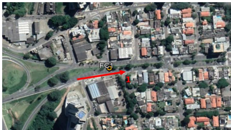
Resultados por faixa horária