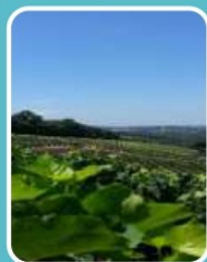
Figura 4 – Oportunidades