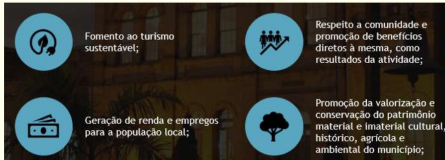
Figura 12. Princípios Norteadores do Plano Municipal de Turismo

A partir destes objetivos, foram desenhados um conjunto de Programas que objetivam atender as necessidades das principais áreas estratégicas de desenvolvimento do turismo, a saber: