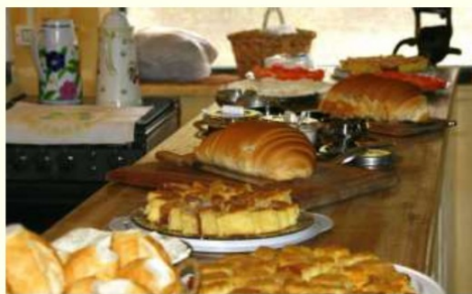
Figura 10. Café Rural - As fartas mesas do turismo rural

O dia-a-dia do campo, as tradições, a culinária, as frutas frescas e direto do pé, atrativos estes cercados pela hospitalidade tão característica da roça podem ser vistos nos roteiros rurais de Jundiaí, que se completam pelas adegas de produção de vinho artesanal e pela cultura italiana tão presente na região, pelos causos, pelas paisagens, pelos sons e pelos cheiros de doce feito no fogão à lenha, de bolos e pães fresquinhos, servidos junto ao café feito na hora.