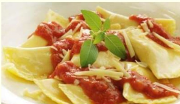
Figura 8. Tortéi de Abóbora - Das tradições italianas herdou-se também o tortéi. Massa tradicional recheada com abóbora, presente nos cardápios dos restaurantes típicos da cidade.

Opções diversas para quem procura o melhor da cultura italiana, elaborada pelas tradicionais famílias imigrantes daquele país. Além disso, Jundiaí conta com regiões gastronômicas. São lugares onde há uma grande concentração de restaurantes, como por exemplo, o bairro do Caxambu, o bairro do Traviú e Bulevar Beco Fino. Experiências gastronômicas variadas converteram a cidade em uma referência neste segmento, que atrai muitos visitantes em busca dos diferenciados restaurantes da cidade.