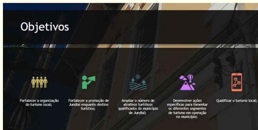
Figura 15. Objetivos do Plano Municipal de Turismo