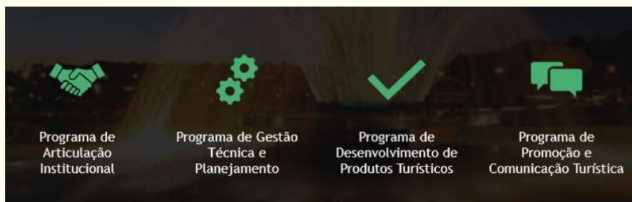
Figura 17. Programas