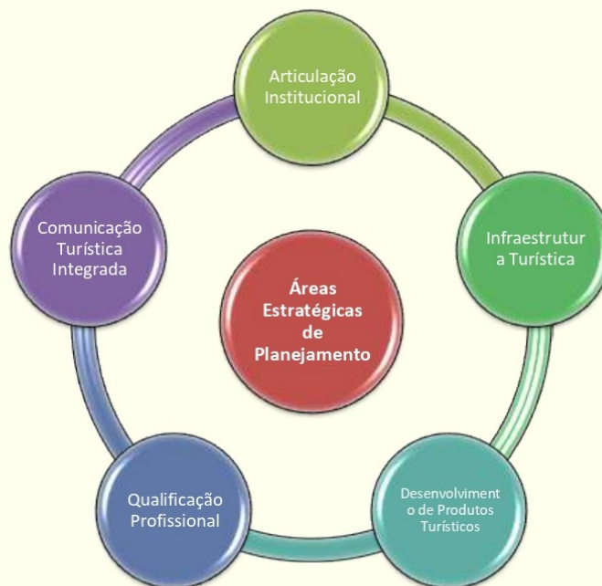
Figura 13. Áreas Estratégicas

A partir destes objetivos, foram desenhados um conjunto de Programas que objetivam atender as necessidades das principais áreas estratégicas de desenvolvimento do turismo, a saber: