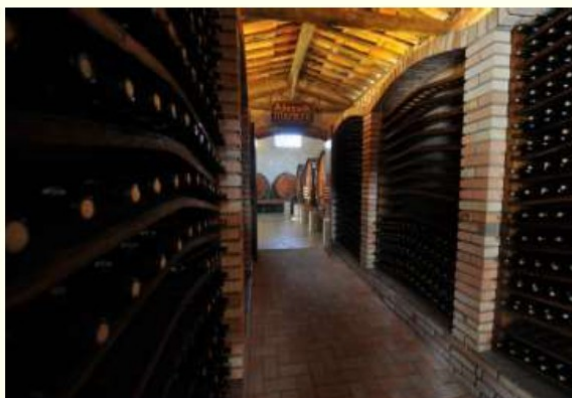
Figura 9. Adega Maziero - As tradicionais adegas são sempre um convite à degustação do vinho artesanal.

oferecem ao turista a oportunidade de conhecer um pouco da produção e da história das famílias que se dedicam ao vinho na cidade há décadas.