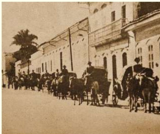
Figura 6. Rua Barão de Jundiaí - Século XIX

Jundiaí foi, em um passado muito próximo, uma das principais cidades responsáveis pelo desenvolvimento do interior do Estado de São Paulo. A história da produção cafeeira, a instalação da ferrovia, a vinda dos imigrantes, a produção de uvas e vinho e, posteriormente, o desenvolvimento da indústria, promoveram o crescimento da cidade e estes diversos ciclos