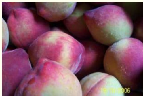
Figura 11. Produção de Pêssegos - Sítio Vendramin - Integrante do Circuito das Frutas, Jundiaí se destaca pela produção de pêssegos, goiabas, ameixas, caquis e várias outras frutas, além da uva, tão tradicional.

A região como um todo tornou-se referência, como dito, em turismo rural e possui destaque no estado de São Paulo enquanto destino deste segmento.