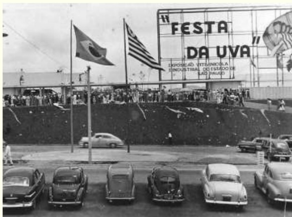
Figura 7. Festa da Uva Imagem da 1ª. Festa da Uva, realizada em 1934.

Jundiaí realiza anualmente inúmeras festas tradicionais. Realizando anualmente a tradicional Festa da Uva, que completou 85 anos em 2014, o calendário de eventos jundiaieenses inclui ainda a tradicional Festa da Colônia Italiana, a Festa Portuguesa, a Festa do Vinho Artesanal e outras festas tradicionais, que apresentam sua culinária típica, suas tradições, e contam a história de Jundiaí e dos povos que construíram esta maravilhosa cidade.