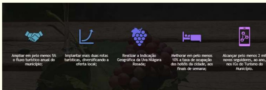
Figura 16. Metas do Plano Municipal de Turismo

Como metas para o Plano Municipal de Turismo de Jundiá foram estabelecidos: