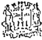
TABELA DE SALÁRIOS DE MÉDICOS E ODONTÓLOGOS