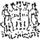
TABELA DE VENCIMENTOS DE CARGOS EM COMISSÃO