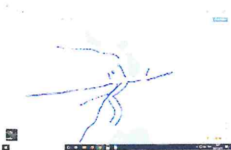
Google Maps - Travessas - Augusto Mazi - Loteamento Pinheirinhos.png 192K