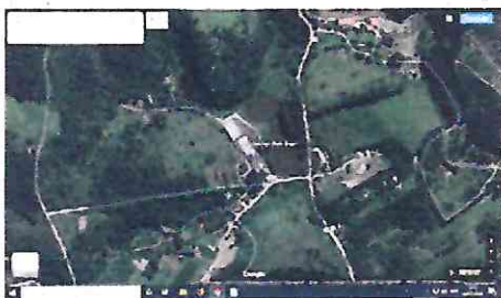
Travessa Augusto Mazi - Denominação.JPG 272K