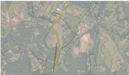
Via de Pedestre 1 - Chácara São Vicente.jpg 553K