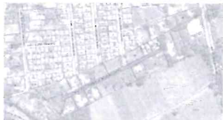
Anexo_1354760_Croqui_Rua_01____ Residencial_Altos_das_Vinhas.jpg 544K