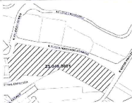
Praça PET & Família - Cidade Jardim.png 81K