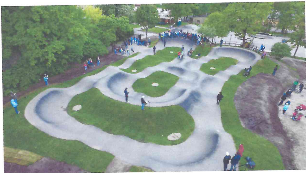
Exemplo de Pumptrack de Asfalto desenvolvido pela empresa Velosolutions

Pumptrack é um tipo de pista que consiste em percurso com “lombadas” ou “rollers”, que possibilitam a aceleração da bicicleta sem o uso dos pedais. A técnica de Pump ajuda na consciência corporal para se adaptar às condições do terreno, absorvendo impactos e promovendo aceleração com menor energia nas trilhas (Zoom Bike Park). O pumptrack de asfalto é reconhecido como uma pista poliesportiva do mundo das rodinhas, pois pode ser utilizado pela bike, skate, patins, cadeirantes e patinetes. Diferente de outros tipos de pistas, o pump é inclusivo para todos os níveis e idades, pois os inexperientes podem apenas passar pelos rollers da pista, ao contrário dos experientes que usam para saltar, se conectando a uma parte e outra dos rollers e mesas. Na imagem abaixo podemos visualizar um exemplo de pumptrack de asfalto.