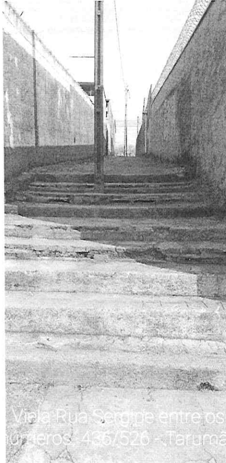
Vial Rua Sergipe entre os árduos - 436/526 - Tarumã