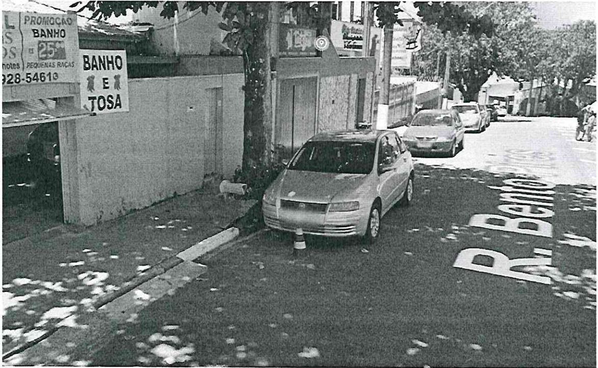
Rua Bento Pires, 69 – Vila Arens.