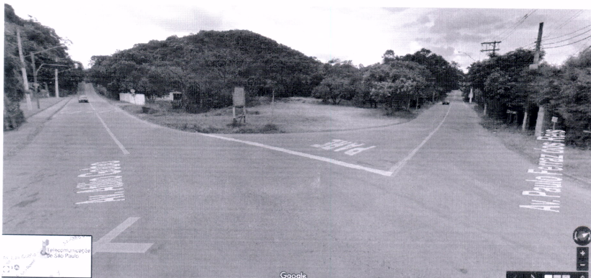
Imagem disponível em 30/05/2017 no endereço: https://www.google.com.br/maps/@-23.2523976,-46.8992273,3a,75y,114.72h,82.29t/data=!3m6!1e1!3m4!1soeh3LJR2neORn-FasKJOdAI2e0!7i13312!8i6656 .

Entroncamento das avenidas Atílio Gobbo e Paulo Ferraz dos Reis (Santa Clara)