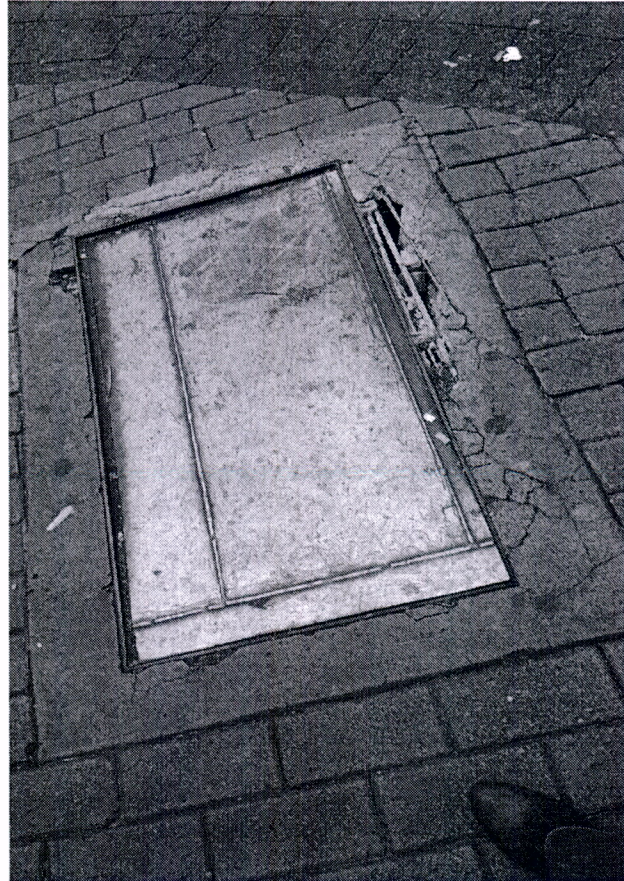
Rua Barão de Jundiaí esquina com a Rua Anthero dos Santos