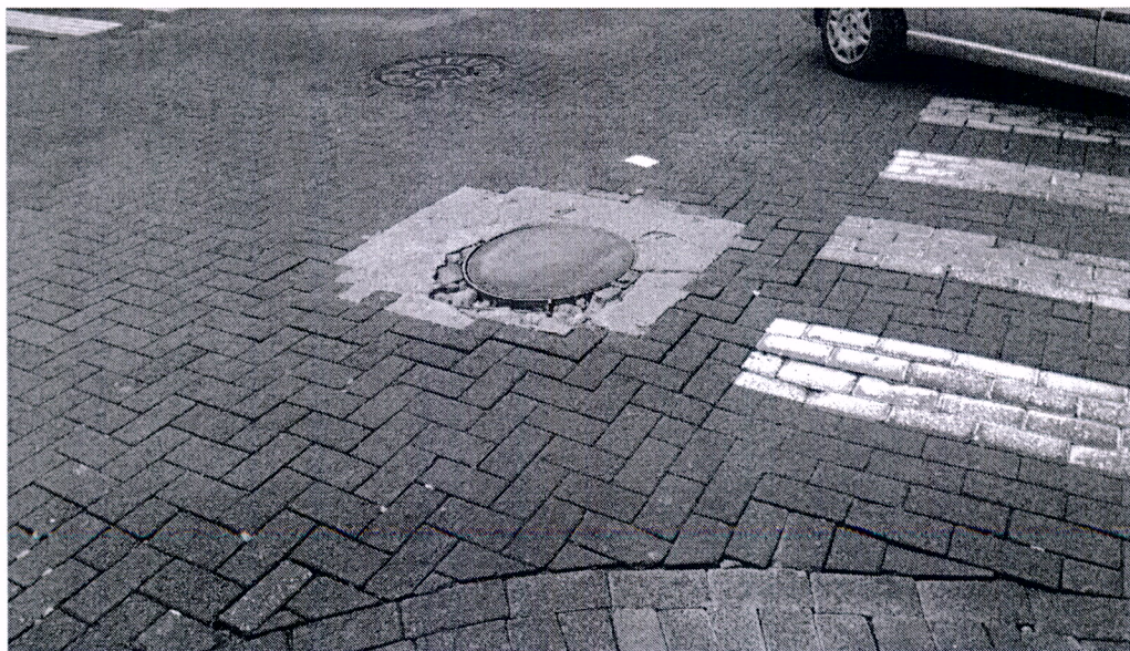
Rua Barão de Jundiaí esquina com a Rua Engenheiro Monlevade