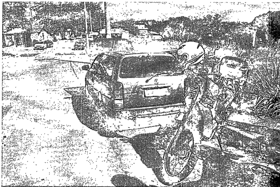
Veículo furtado foi localizado pela GM