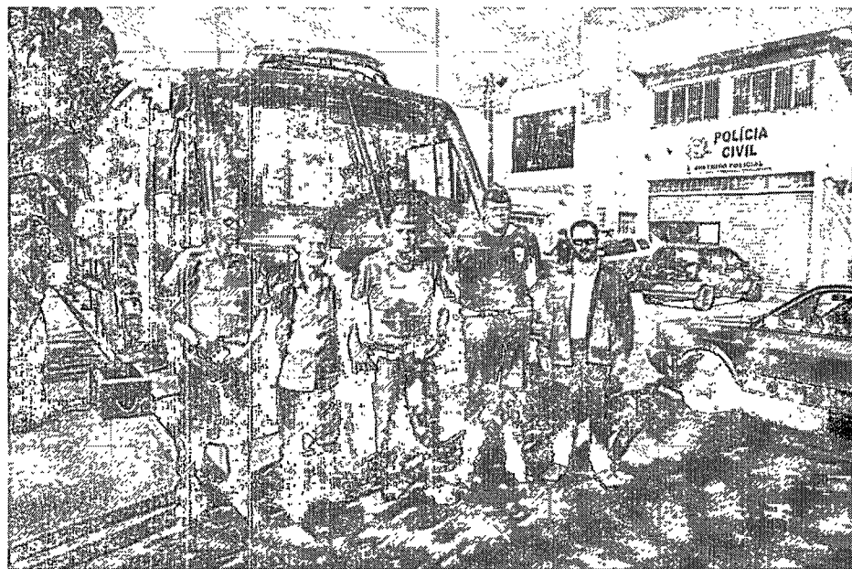
Trabalho integrado das forças policiais é destaque na cidade

Plano de Segurança surpreende moradores da Vila Rami