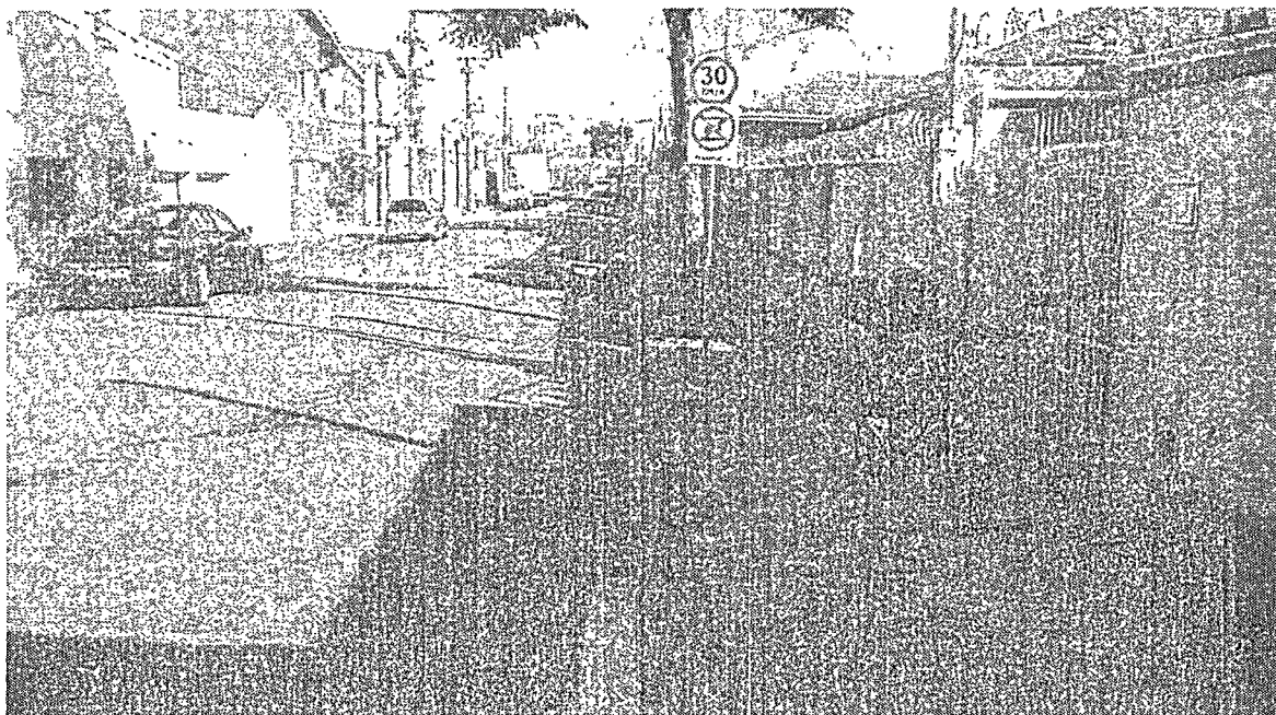
CASA 20, COM A CALÇADA BASTANTE TRINCADA