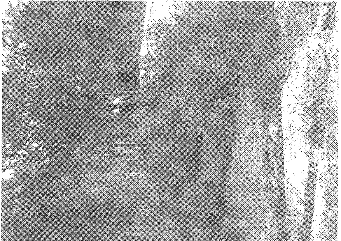
Anexo da Indicação n.º 5182