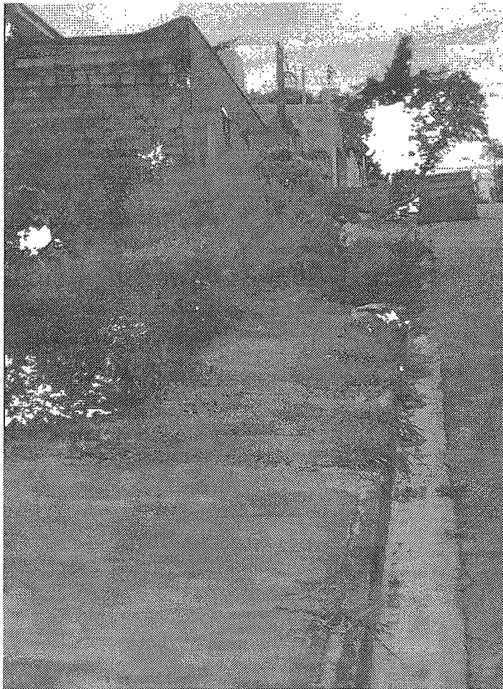
Anexo da Indicação n.º 5181