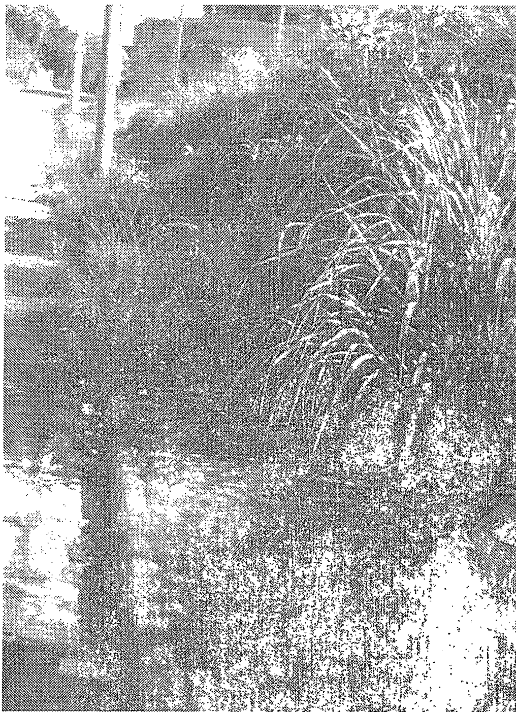
Anexo da Indicação 1.º 05.014