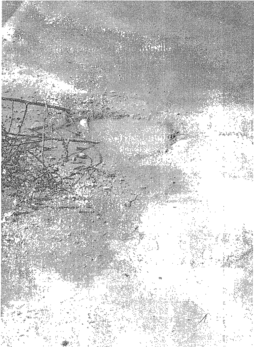
Anexo da Indicação n.º 05023