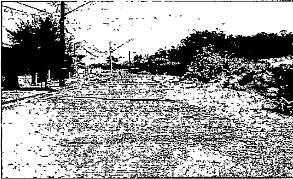
Cidade Nova I Foto 1