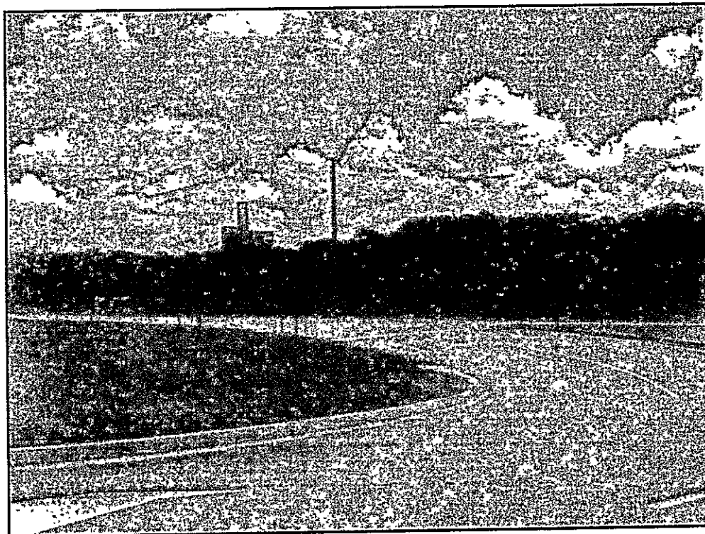
Vista da Av. Projetada "1"